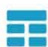
Tableau de bord : Des indicateurs clés pour suivre l'activité de votre entreprise

Achats : Suivi des factures d'achats et de leurs règlements